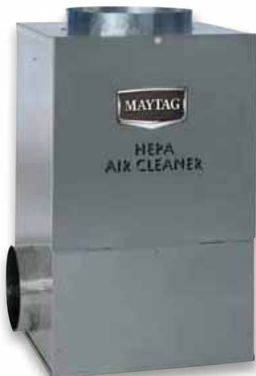
Purificador de aire HEPA