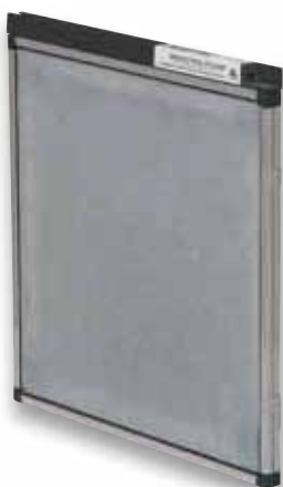
Filtro electrónico de aire de 1 pulgada

Estas soluciones pueden instalarse con cualquiera de nuestros productos de sistema dividido (split), pero para una mejor mezcla de aire que reduzca el estancamiento, se recomiendan los sistemas de calefacción y refrigeración con opciones de velocidad variable.