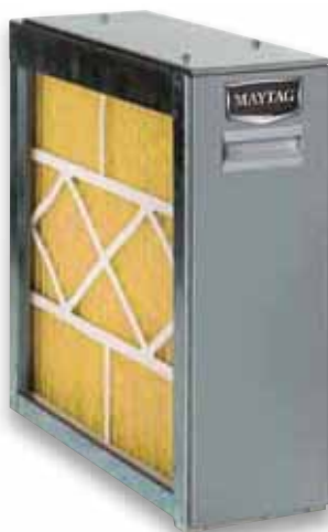
Filtro de profundidad