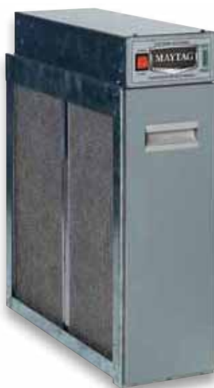
Purificador electrónico de aire