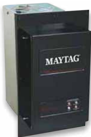
Purificador UV de aire