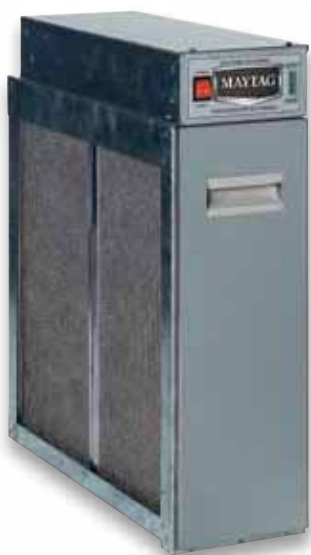
Purificador electrónico de aire

El uso de una combinación de estos productos proporciona la mejor solución para aumentar el confort interior de los ocupantes que sufren alergias. Estas soluciones pueden instalarse con cualquiera de nuestros productos de sistema dividido (split), pero para una mejor mezcla de aire que reduzca el estancamiento, se recomiendan los sistemas de calefacción y refrigeración con opciones de velocidad variable.