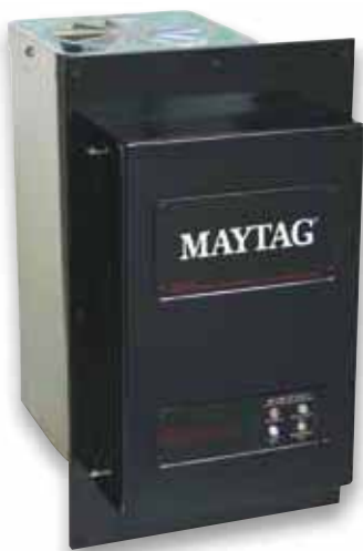
Purificador UV de aire